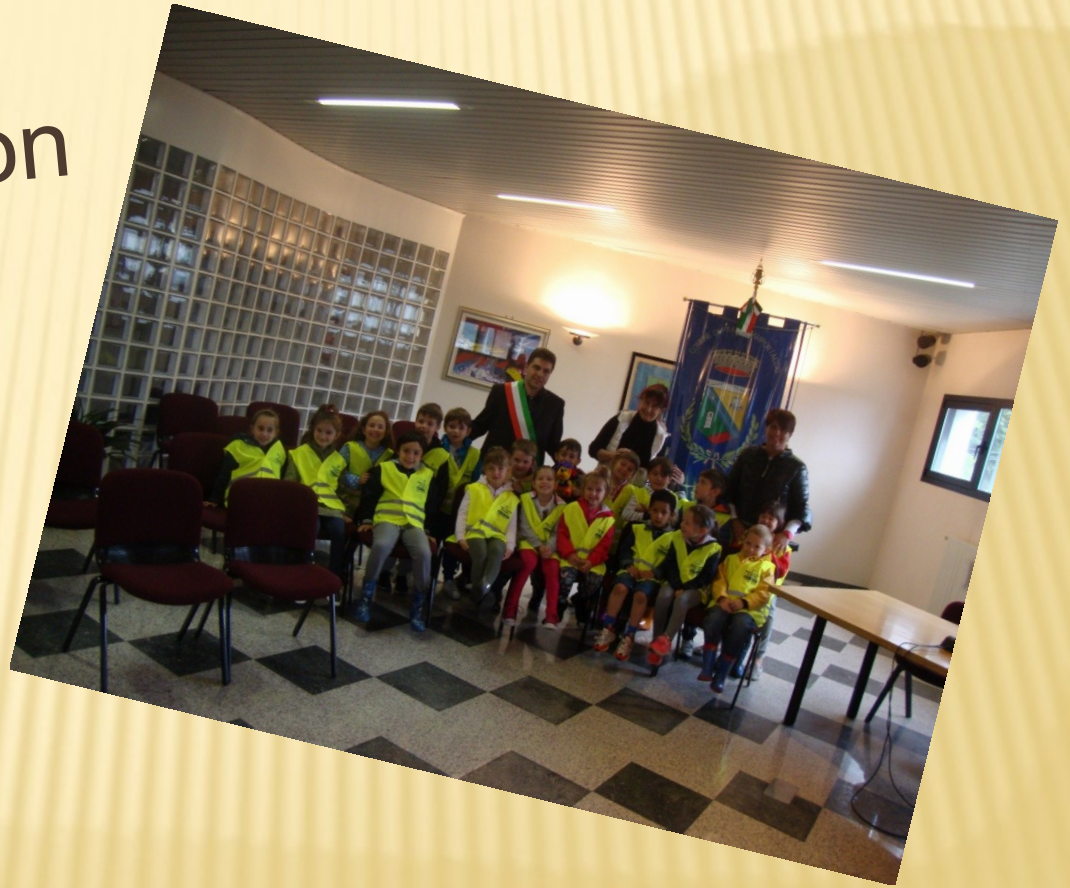
Foto di gruppo con il Sindaco e il gonfalone del Comune